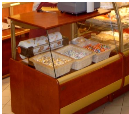
B oks kasowy BK